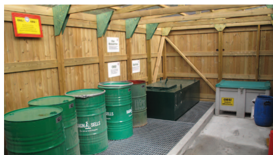
Var noga med att följa instruktionerna som finns uppsatta så det miljöfarliga avfallet kommer där det hör hemma.

Låt oss tillsammans göra SSS till ett miljömedvetet segelsällskap!